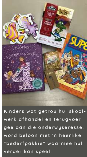
Kinders wat getrou hul skoolwerk afhandel en terugvoer gee aan die onderwyseresse, word beloon met 'n heerlike "bederfpakkie" waarmee hul verder kan speel.