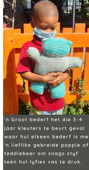
'n Groot bederf het die 3-4 jaar kleuters te beurt geval waar hul elkeen bederf is met 'n lieflike gebreide poppie of teddiebeer om snags styf teen hul lyfies vas te druk.