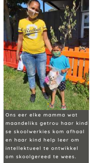
Ons eer elke mamma wat maandeliks getrou haar kind se skoolwerkies kom aphaal en haar kind help leer om intellektueel te ontwikkel om skoolgereed te wees.